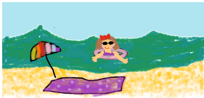
rysunek: Gabryśia Rotter, klasa 4

Wyjazd na wakacje to ekscytujące, radosne wydarzenie. Już za chwilę będziecie mogli cieszyć się urokami wypoczynku i zapomnieć o szkole. Aby jednak podróż była bezpieczna powinniście przestrzegać kilku zasad, które pomogą uniknąć nieprzyjemnych przygód.