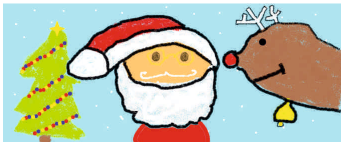
Bartosz Golonka, klasa 3b