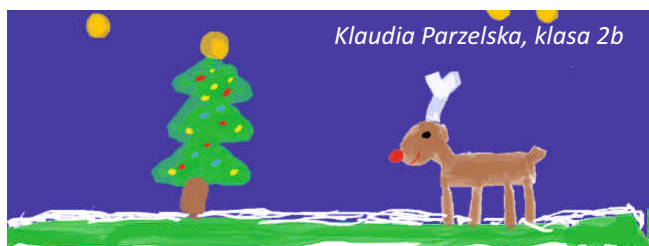
Klaudia Parzelska, klasa 2b

Spam - jedyna rzecz którą na pewno dostaniesz pod choinkę.