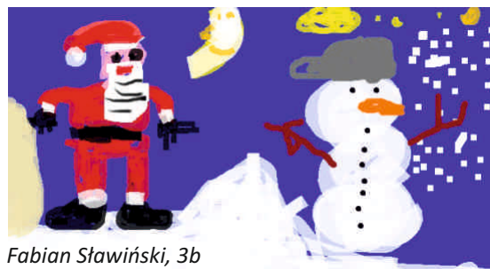
Fabian Sławiński, 3b