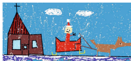
Igor Czerkas, 2c