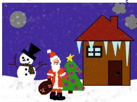
Gabrysia Rotter, klasa IV