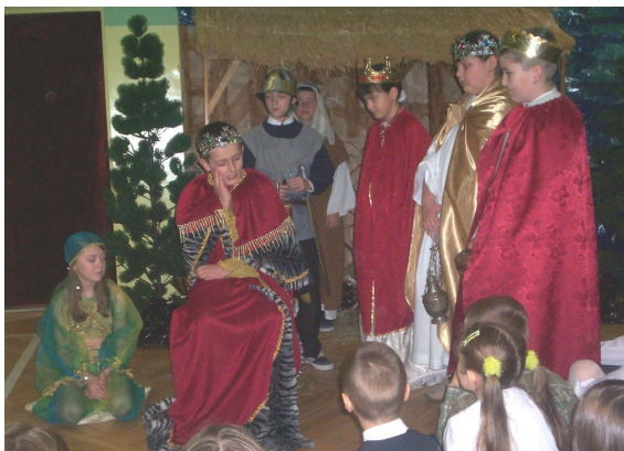
Zachwycała gra i stroje aktorów.

Widzów zaskoczyło nowatorskie przedstawienie jasełek. Wydarzenia sprzed ponad dwóch tysięcy lat pokazano w sposób dynamiczny i nowoczesny za pośrednictwem przekazu telewizyjnego. Przedstawiając sceny biblijne nie unikano dowcipnych dialogów. Widzowie z ciekawością obserwowali świetną grę aktorów. Na scenie zobaczyliśmy 23 uczniów z klas IV-VI. Na wyróżnienie zasługuje również podkład muzyczny oraz stroje aktorów oraz kolędy i pastoralki w wykonaniu szkolnego chóru.