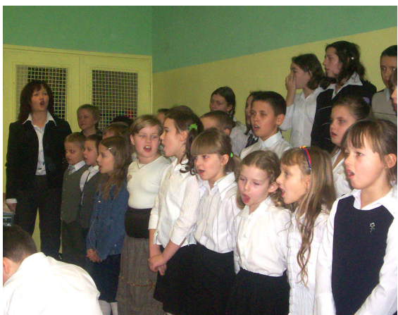
Chór pięknie odśpiewał kolędy i pastoralki.