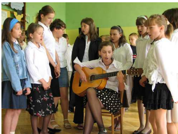
Klasę VI śpiewająco żegnała klasa V. Dziś to oni są najstarsi wśród uczniów naszej szkoły...