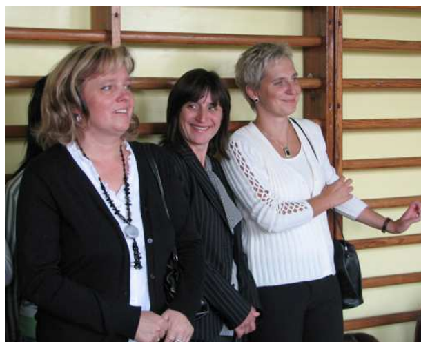
Grono pedagogiczne w dobrych humorach