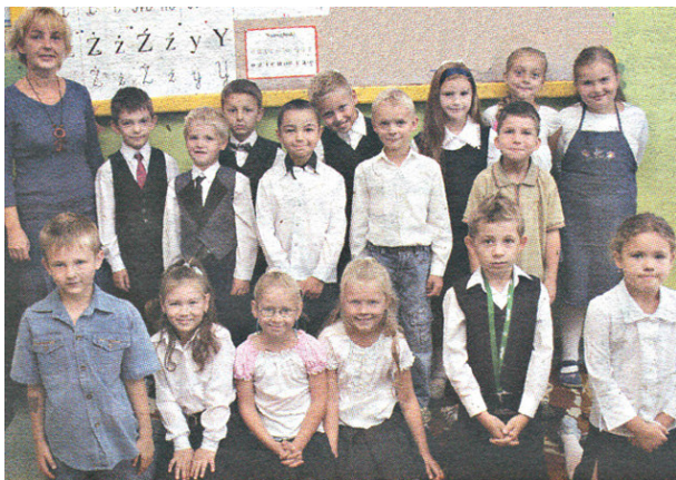
Klasa I A

Krakowską tradycją stało się umieszczanie zdjęć klas pierwszych w jednym z wydań Gazety Krakowskiej. W tym roku podobizny I A i I B ukazały się w numerze z 17 października. Oto te zdjęcia: