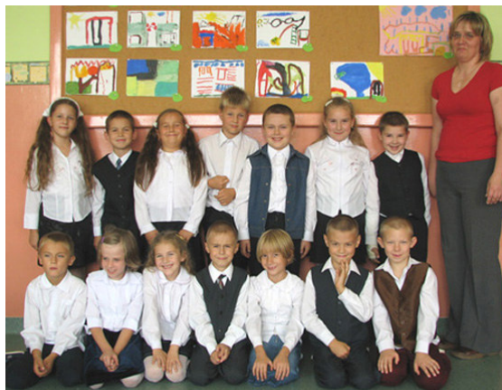
Klasa I B